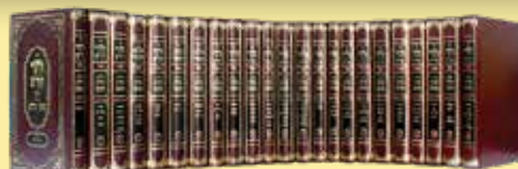
גרויסע סעט (In 9.5/6.5)

"ובלכתך בדרך" פארמאט 70 כרכים מהדורת ר' יוסף צבי בערגער (6.5/4.5 in)